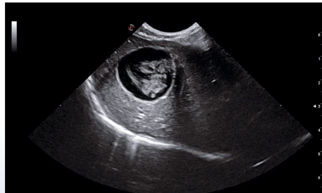
Hund – Gallengries – B-Mode