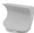
ANTENNE RACHIS (OPTIONNEL)