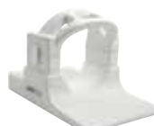
ANTENNE TÊTE LARGE (OPTIONNEL)