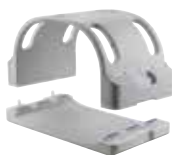
ANTENNE LARGE RACHIS 4 CANAUX